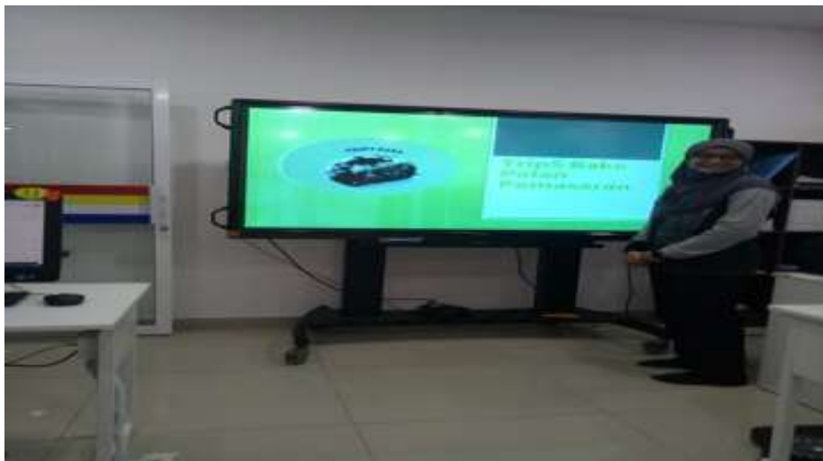
Modul 6-10 Salah seorang peserta membentangkan pelan pemasaran perniagaan