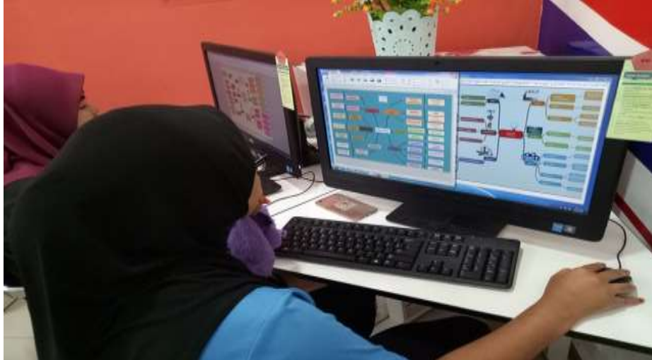
Modul 6-10 Peserta sedang membuat peta minda mengenai idea perniagaan