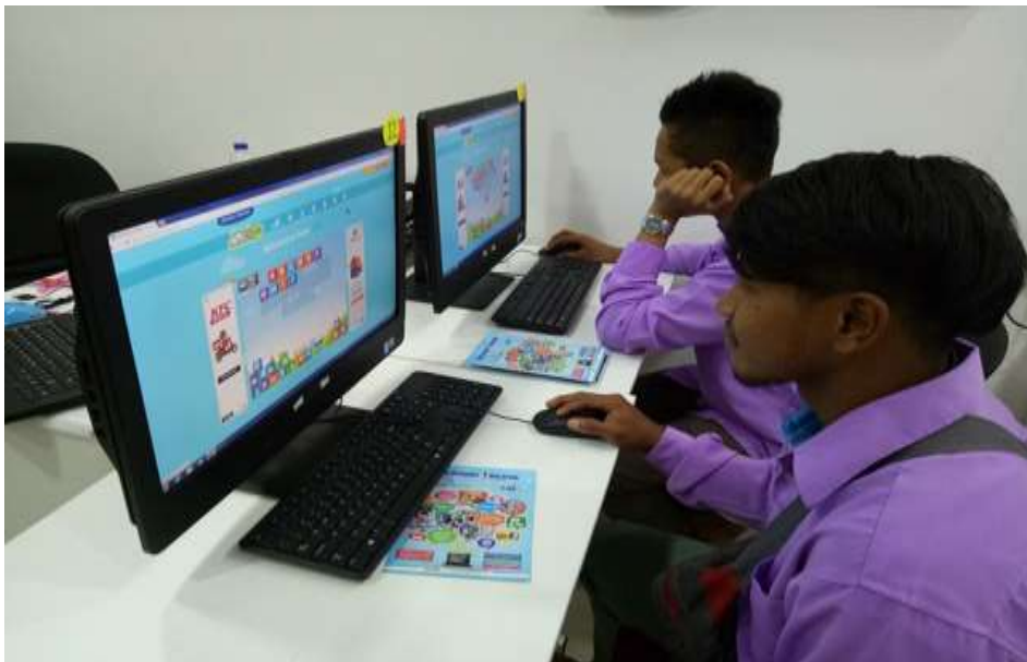
Sedang melakukan penyusunan Abjad