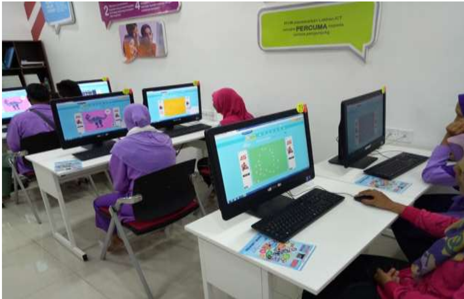
Para pelatih sedang membuat latihan