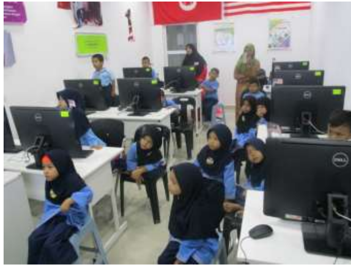
Petugas menerangkan tentang peralatan computer (Kanak-kanak dari Tabika Al-Islah A)