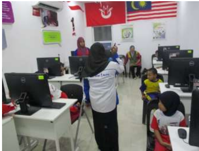
Petugas menerangkan tentang peralatan computer (Kanak-kanak dari Tabika Al-Islah B)