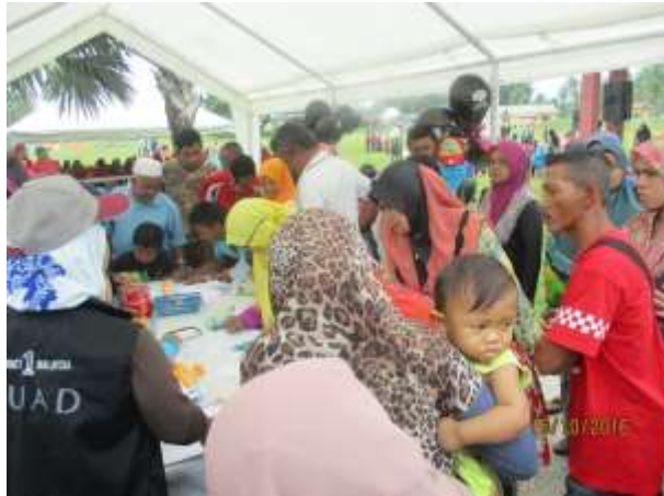
Antara pengunjung yang hadir di Booth Pusat Internet 1Malaysia yang terdiri daripada pelbagai lapisan umur