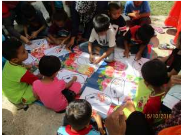
Antara Aktiviti Permainan yang dijalankan oleh Booth Pusat Internet 1Malaysia Kluster Gua Musang