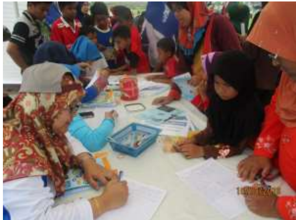
Sesi Pendaftaran pengunjung dan pembahagian Nombor cabutan bertuah