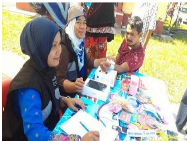
Antara pengunjung yang memeriksa tahap kesihatan dengan menggunakan Peralatan I-health yang telah dibekalkan untuk Program Dashboard MyHealth