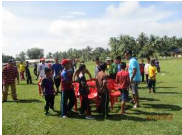
Antara Aktiviti Sukan dan Riadah yang dipertandingkan pada hari tersebut yang melibatkan pelbagai kategori umur dan jantina