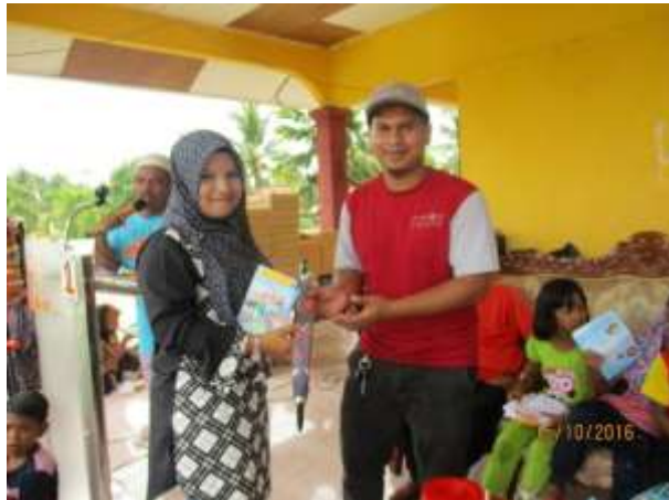
Antara pengunjung yang memenangi hadiah untuk kategori Cabutan nombor bertuah yang dibekalkan oleh Booth Pi1M Kluster Gua Musang