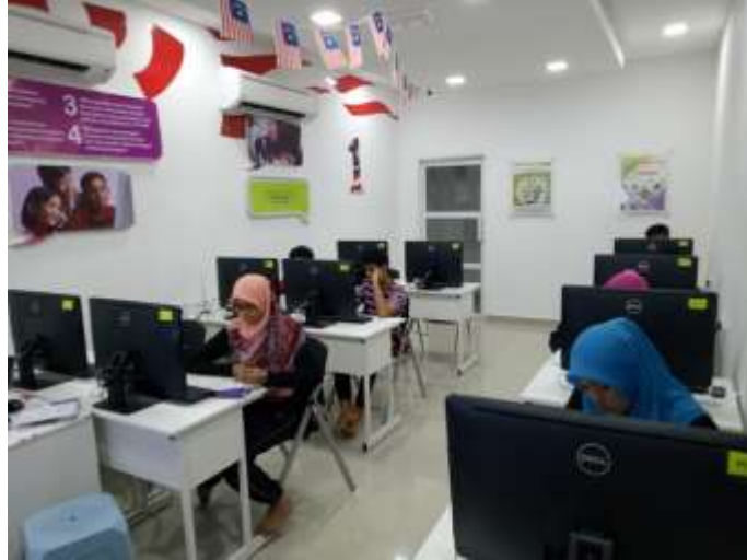
Modul 6-10 Peserta sedang merancang idea perniagaan