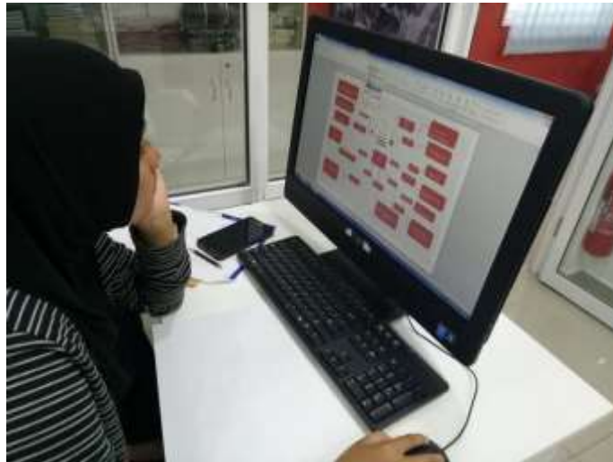
Modul 6-10 Peserta sedang membuat peta minda mengenai idea perniagaan