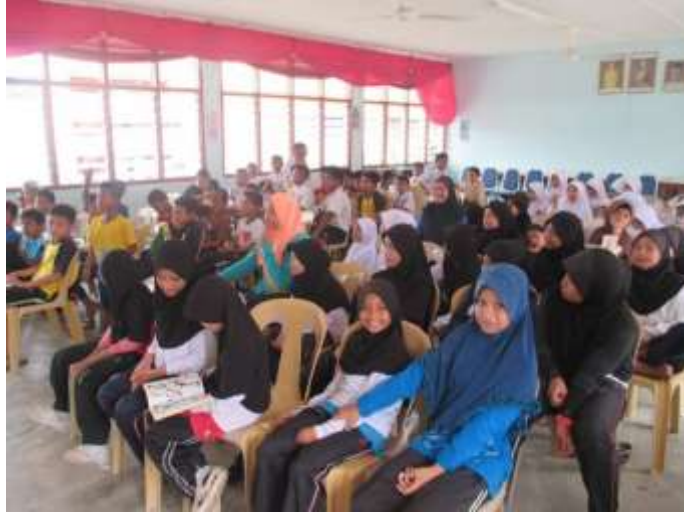
Taklimat promosi Pi1M kepada pelajar