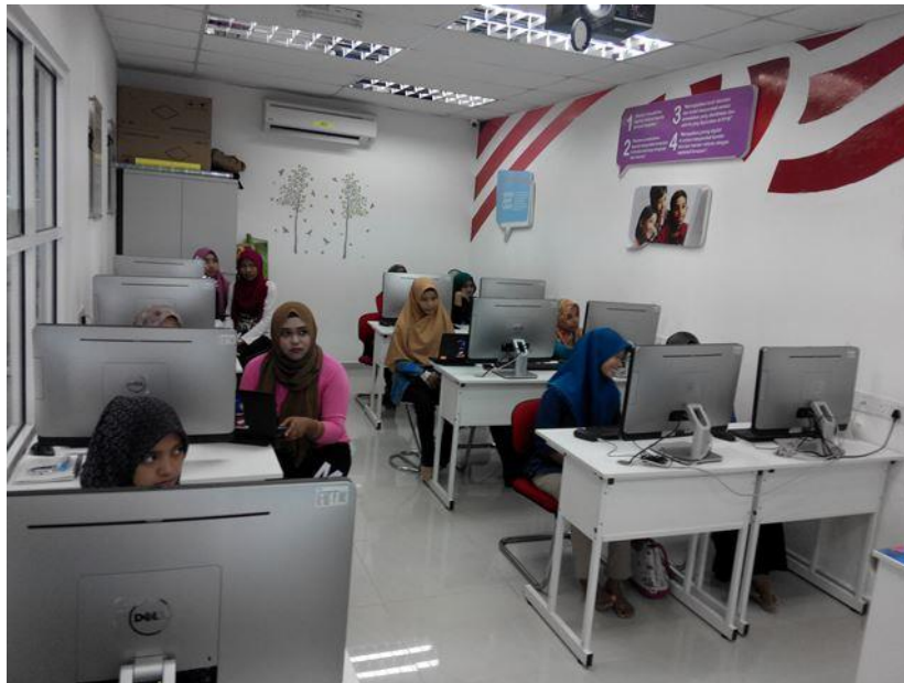
Taklimat Klik Dengan Bijak