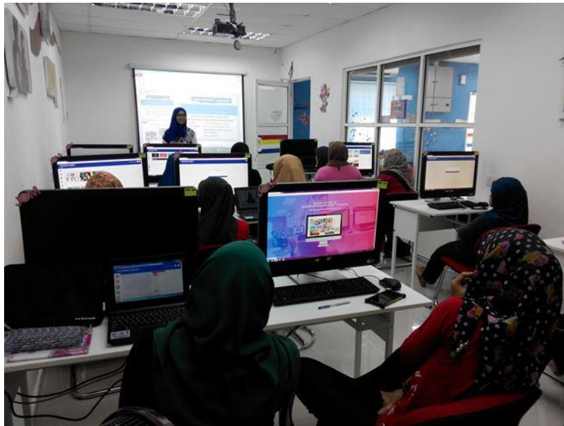
Penerangan Dashboard serta latihan penggunaan