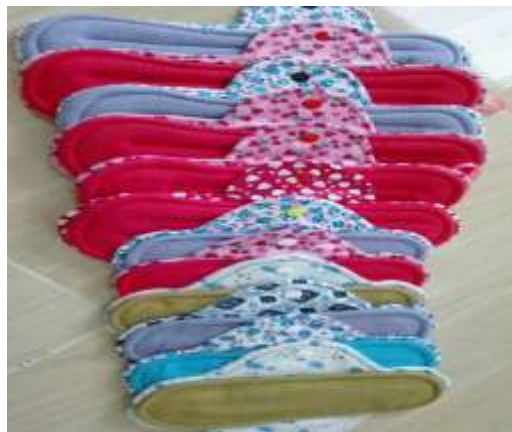
Caption : Antara produk-produk yang dijual