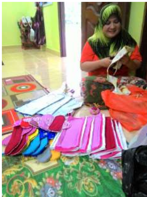
Rajah 1: Langkah pertama dalam menghasilkan pad wanita.

iii) Lain-lain (contoh : proses penghasilan produk, penglibatan dalam aktiviti lain, dsb)