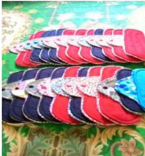
Rajah 2: Pad wanita yang terdiri daripada pelbagai saiz dan corak kain yang menarik.