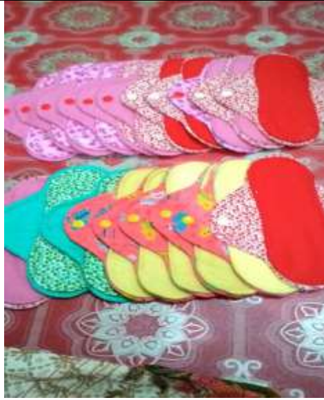
Rajah 1: Contoh pad wanita yang siap dihasilkan.