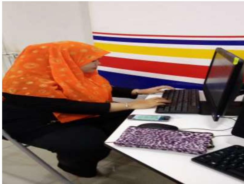
Sedang menggunakan aplikasi iHealth semasa program Dashboard Komuniti

iv) Lain-lain (contoh : proses penghasilan produk, penglibatan dalam aktiviti lain, dsb)