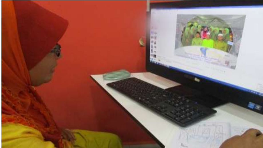
Photo editing menggunakan Photoscape