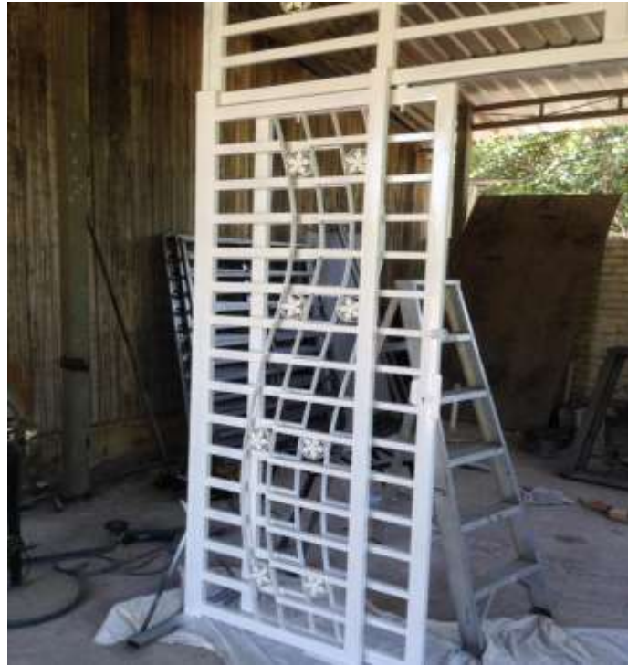
Caption : Antara Perkhidmatan yang ditawarkan oleh beliau