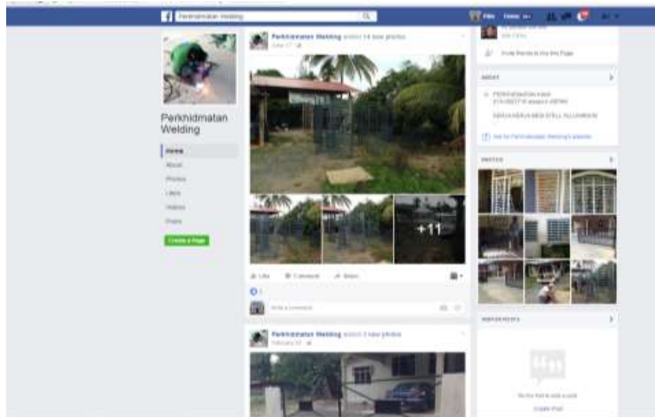
Caption: Facebook Page