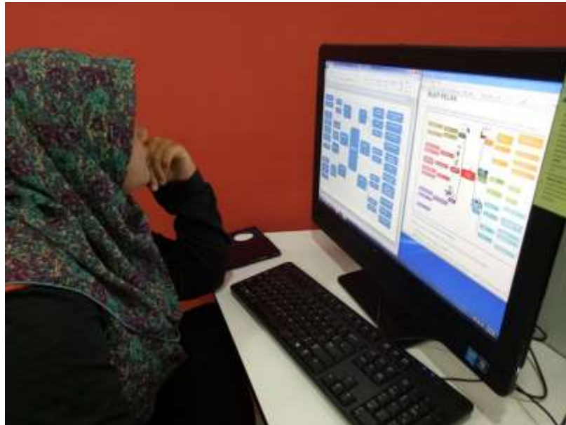
Modul 6-10 Peserta sedang membuat peta minda mengenai idea perniagaan