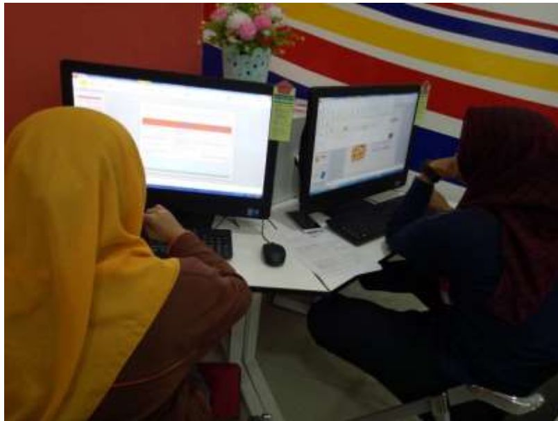
Modul 6-10 Peserta sedang menyiapkan pelan pemasaran perniagaan